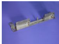
Biegeteile aus Edel- stahl Wig-geschweißt