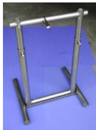
komplette Baugruppen Mag-geschweißt