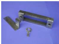
Schweißteil für Ver- packungsmas- chinen