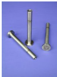
Edelstahlwelle n komplett gefertigt