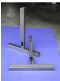
Geschweißte Rohr- konstruktion