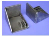
Bearbeitete Schweiß- konstruktion