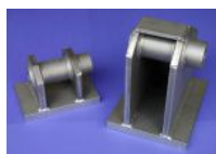
Geschweißte Brenn- schneidteile